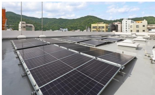
40Kwの太陽光パネルを屋上に設置 (オンサイトPPA)