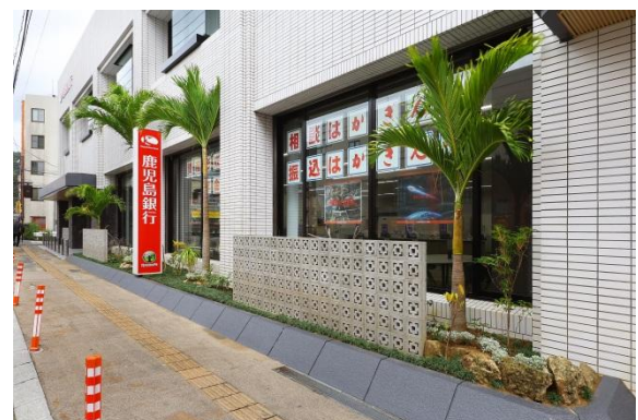
奄美大島らしい植栽や花ブロックを配置