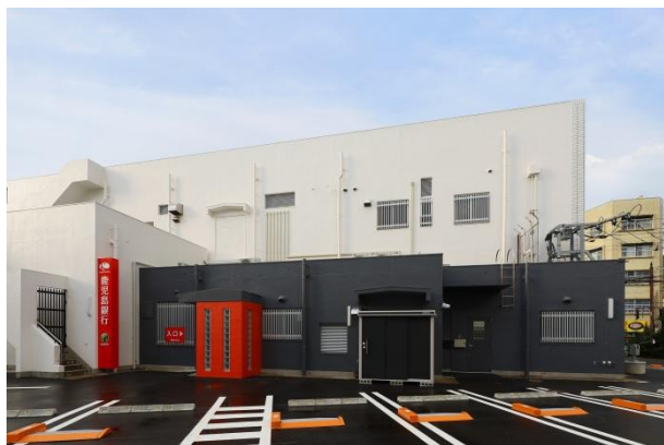
駐車場からアクセスしやすい出入口の新設