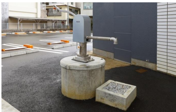
奄美市初の防災用井戸を設置