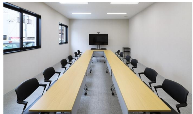
不使用の書庫を改装し、新設した行員用会議室にはモニターを設置しペーパーレス化を促進