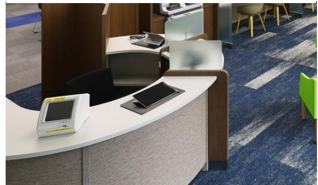
タブレット用カウンターを導入しDXを促進