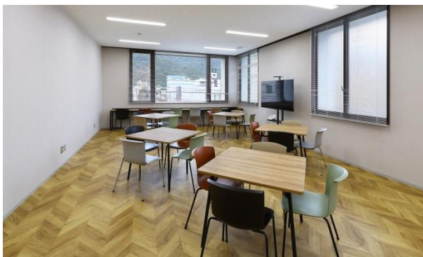
老朽化した行員用休憩スペースは広くなり快適なワークスタイルを確立