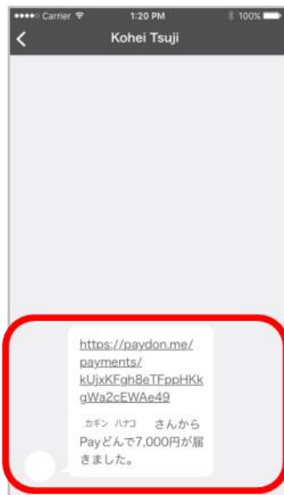
⑥送られてきたURLをタップ。