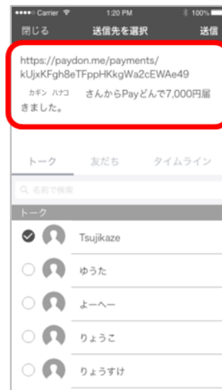
④LINEアプリが自動的に起動。URLが自動生成され、送信先を選択する。