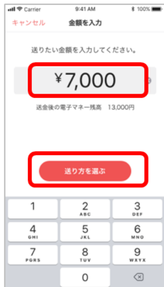
②送金金額を入力し、「送り方を選ぶ」を選択。