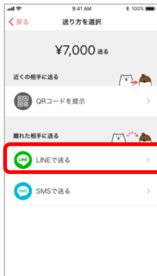
③「LINEで送る」を選択。※SMSで送るも選択可能。