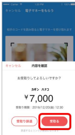
⑦Payどんアプリが自動的に起動。送金者・金額を確認し「受取る」を選択。