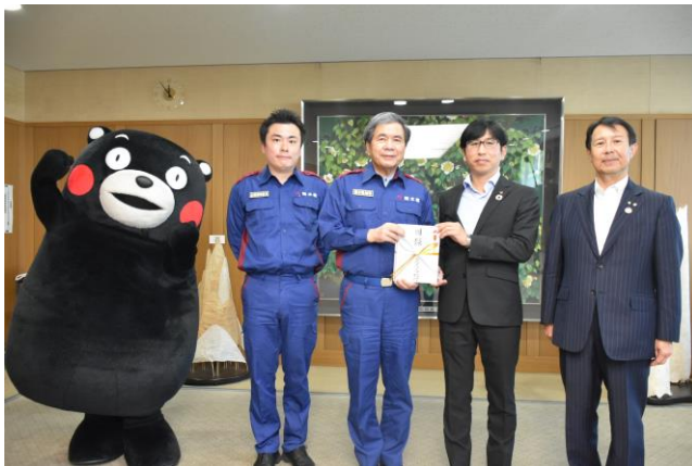
右から、笠原社長、吉満支店長、蒲島熊本県知事、高橋企画振興部長、くまモン