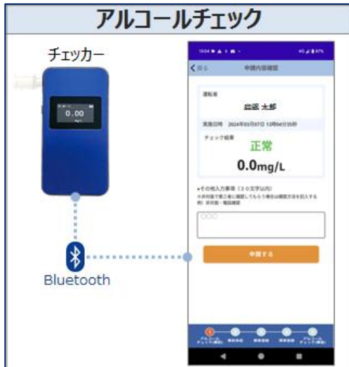
【スマホアプリ画面】